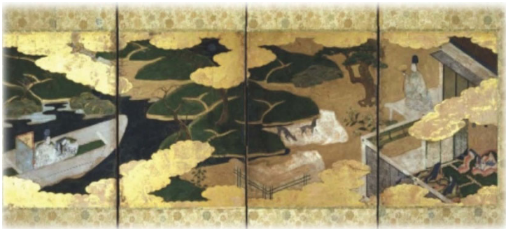
「源氏物語図（夕霧・浮舟）小屏風」 実践女子大学香雪記念資料館 蔵

また同展示と連動して、2月8日（土）には日本の伝統を継承する者による公演を開催。本学の学生も出演し、衣紋道高倉流による十二単の着装実演や、香道御家流による香席を通じて、源氏物語を「現代も生き続ける日本文化」として描きます。