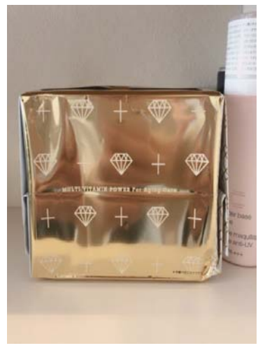
(3)一緒に併用しているもの