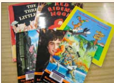
多読本は種類がたくさん！