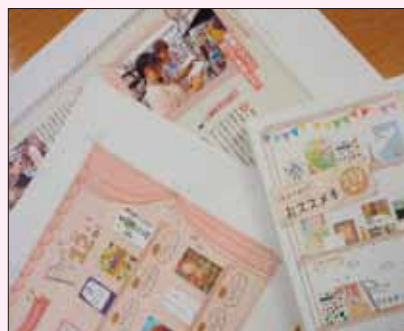
※写真は制作中のものです。

232冊の全てが、32ページにぎゅっと詰まっています。図書館内に置いてありますので、図書館を利用の際にはぜひ1冊お持ちください。