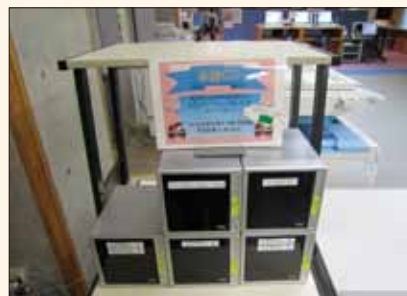
大学のCDはここにありますが！