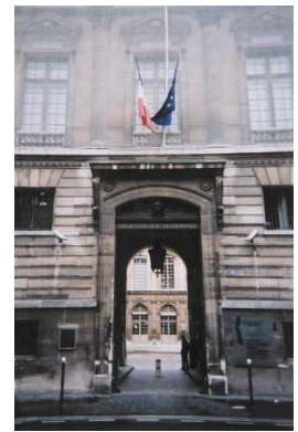
<写真：フランス国立図書館旧館入口>

18世紀後半革命までの約40年間に傑出した2人の司書バングレとメルシェがいる。既に天文学者として知られていたバングレはヘレニズム学者でもあった。1758年の就任後、天体観測所を作らせ、科学書を多く購入した。彼はアミアンやオランダ、遠くはロドリゲス島まで観測旅行に出かけることが多く、留守中の事務は若いメルシェを教育して任せた。弟子は師をしのぐようになり、最初の文献学者の一人となったのである。この二人の時代はSGの最高潮期だった。愛書家であったメルシェの働きは殊に目ざましかった。多くの学者やヴェニスにサン・マルコ図書館の司書とも連絡をとり、本の売り立てに注意を払い、購入や交換によって蔵書を増やしたばかりでなく、それを分類整理してカタログを作った。既に出来ていたものと照合し1758年には刊本目録9巻が完結する。写本の方は1754年から1793年までかかった。バングレとメルシェの共著となっているが殆どはメルシェが書いている。彼は1772年に辞職して僧院を去り、革命後も在職したバングレが写本目録を完成した。1790年の財産登録には6万冊(その中写本は2千点)が記されている。